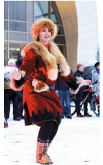
Одна из праздничных площадок эстафеты