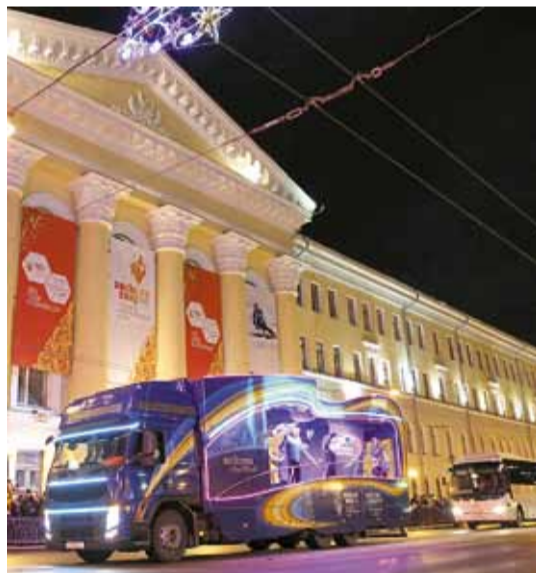
Маршрут огня по улицам Томска