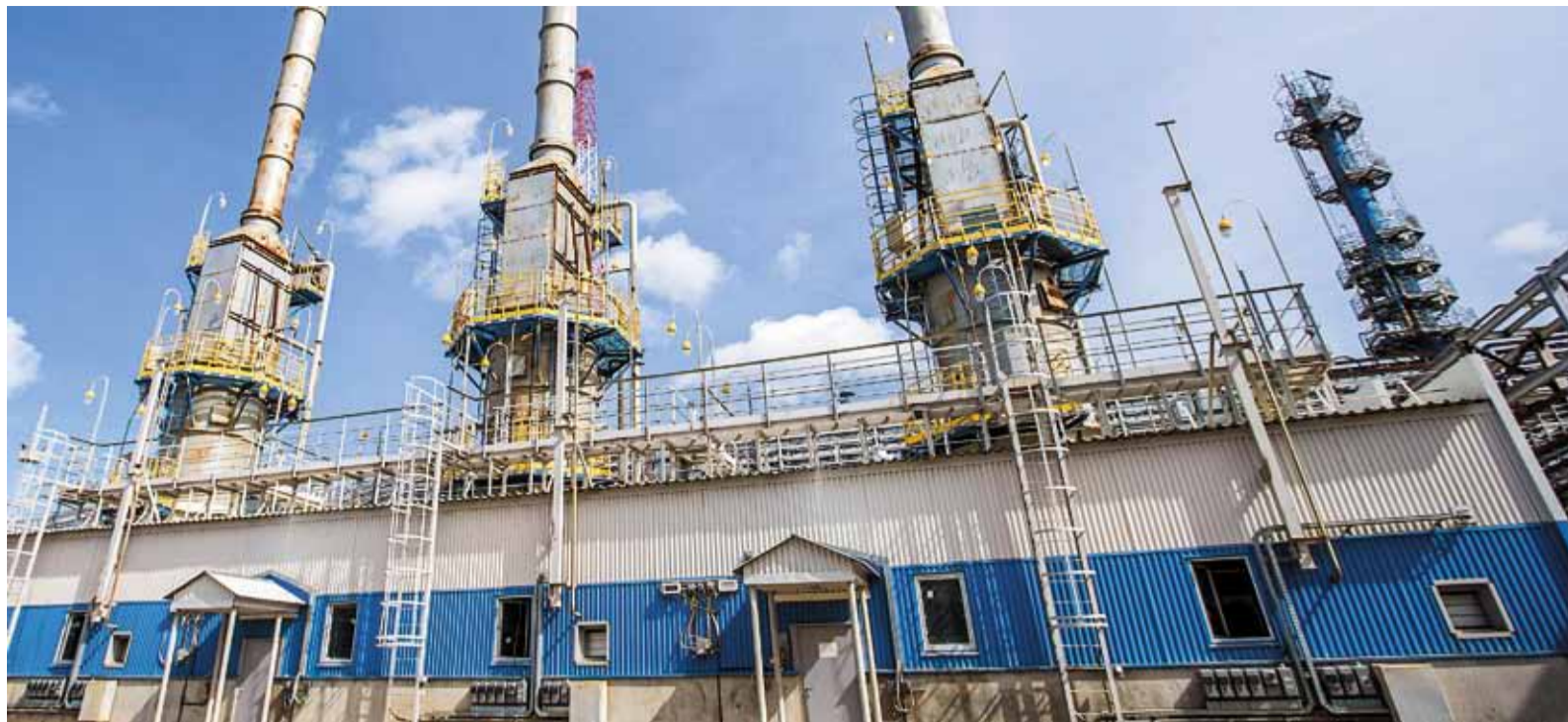
Открытие Киринского месторождения – одно из главных событий в реализации Восточной газовой программы 2013 года