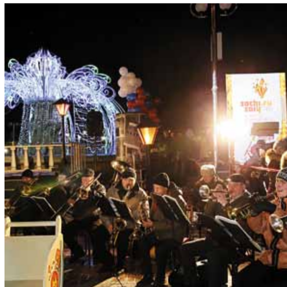
Сочи – далеко, а праздник – рядом!