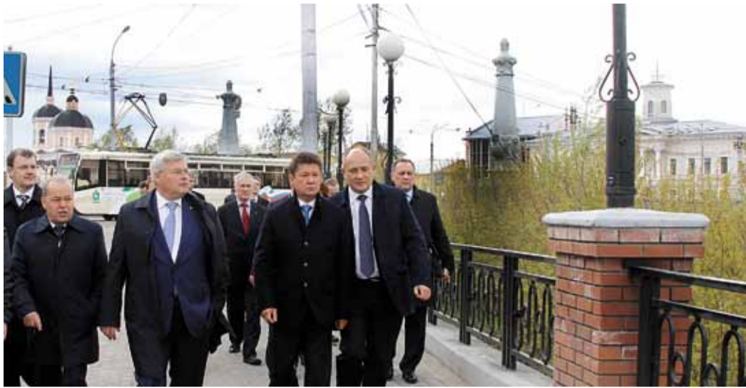
Поддержка Газпрома позволила приступить к реализации проекта «Томские набережные»