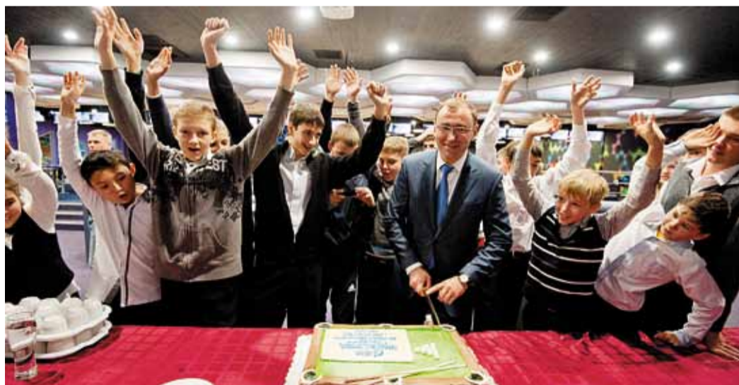
Сладкий приз для всех

В Хабаровске прошел первый турнир по бильярдному спорту среди юношей и девушек в возрасте от 10 до 18 лет на кубок ООО «Газпром трансгаз Томск».