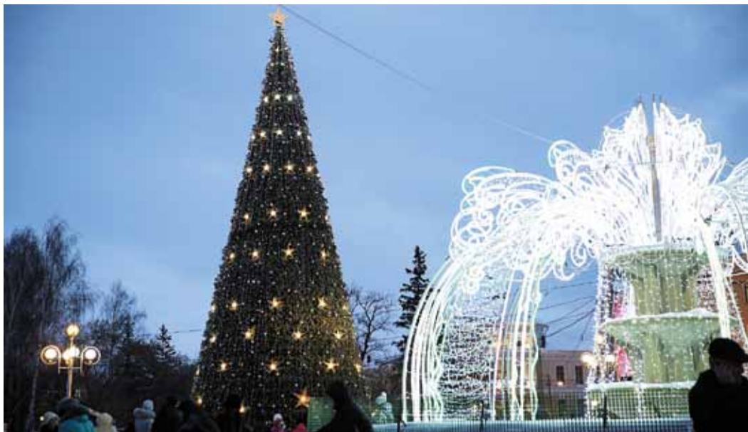
Главная ёлка Томска зажгла свои огни!