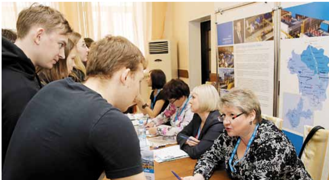
Кадровые предложения «Газпром трансгаз Томск» всегда в центре внимания

Руководители подразделений и специалисты по подбору персонала ООО «Газпром трансгаз Томск» приняли участие в проведении Дней Газпрома, которые прошли в РГУ нефти и газа им. И.М. Губкина, Ухтинском, Санкт-Петербургском государственных технических университетах.