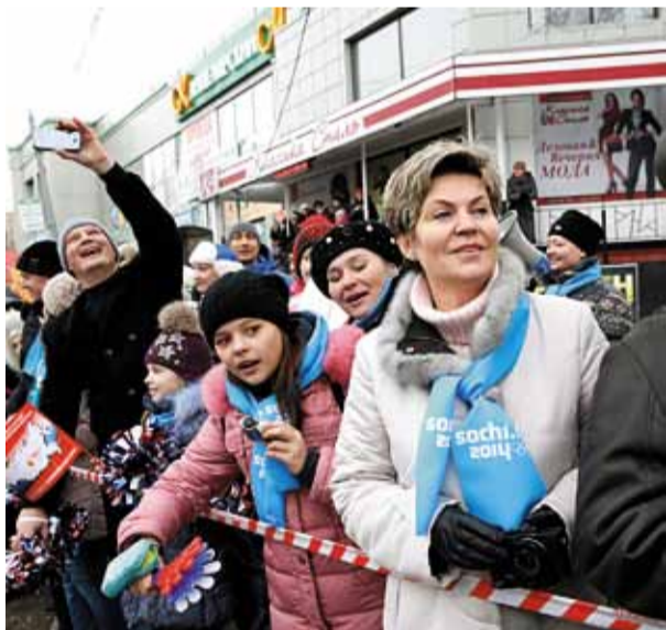
Настоящий олимпийский азарт болельщиков