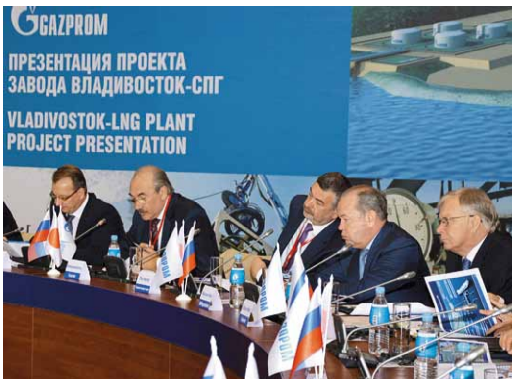
Делегация Газпрома во время презентации завода СПГ на острове Русский

– Главная цель программы – формирование в регионе эффективной газовой отрасли. Это база для динамичного социально-экономического развития Восточной Сибири и Дальнего Востока. В целом на Дальнем Востоке потребление газа выросло в три раза, хороший при-