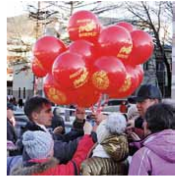
Праздник для каждого!